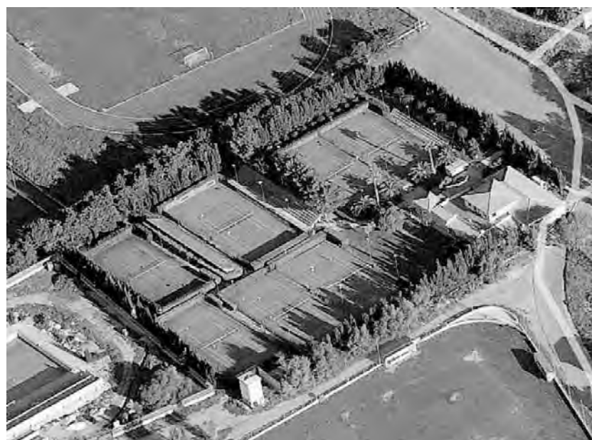
Vista aerea dels camps de Maria Pia

sèptim camp ve realitzat en terra. Del mes de novembre del 2004 al mes de setembre del 2005 se passa a la construcció de la club house i a la remodelació dels vestidors, se crea una palestra, una àrea social amb una terrassa oberta a la recepció i l'entreteniment, una zona de bar amb cuina, els oficis de la Presidència i de la Secretaria, una sala de reunions i pel joc, una terrassa panoràmica, i se instal·la l'ascensor. Aquestes adaptacions permeten el club de obtenir l'organització de manifestacions internacionals com el circuit de la ITF "Futurs Women's Tour" amb els atletes inclosos en la classificació mundial i la participació d'atletes dones com Flavia Pennetta, Mara Santangelo, Roberta Vinci i Tatiana Garbin, campiones que, amb Francesca Schiavone, formaven part de l'equip que ha guanyat al 2006 i 2009 la Federation Cup; el torneig internacional de tennis en cadira de rodes i el Campionat d'Europa under-12 de nacions i, especialment, l'encontre de Copa Davis entre Itàlia i Luxemburg que se fa del 20 al 22 de juliol 2007.