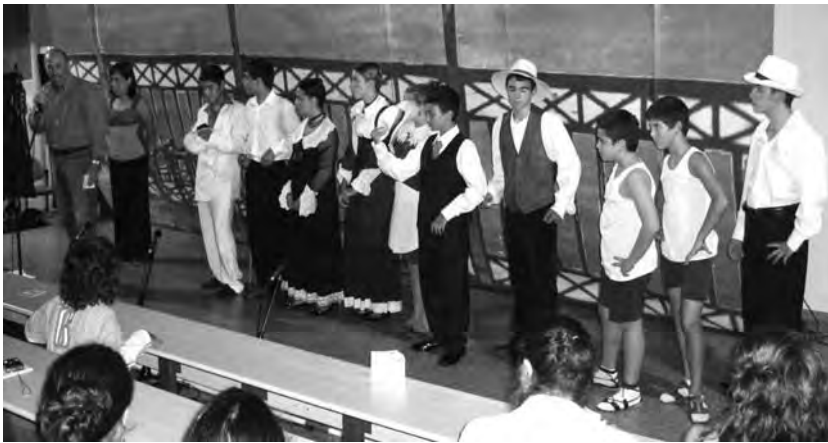
Grup teatral juvenil "El telò"

Una extraordinària presència juvenil ha caracteritzat la XLII edició de la Universitat Catalana d'Estiu a Prada del CONFLENT. Un contribut significatiu en aquesta direcció és vengut de l'Alguer per voluntat de l'Obra Cultural que aquest any ha privilegiat la presència dels joves a Prada amb el grup teatral El Teló , i la presència dels joves cantors a la Coral dels J.I.P.C. (Joves Intèrprets dels Països Catalans), i la mostra de Gabriel Montí, jove fotògraf alguerès.