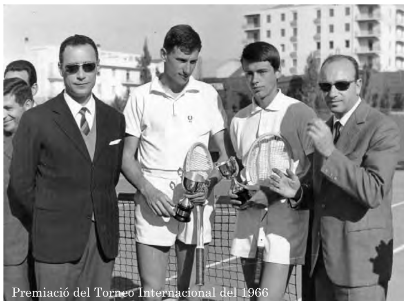
Premiació del Torneo Internacional del 1966

La demanda sempre més gran pel joc del tennis, especialment durant l'estiu, porta el directiu a la determinació de ampliar lo temps de utilització i al 1975 instal·la una il·luminació adequada dels camps a càrrec del club, fet que consenteix la disponibilitat i l'ús dels camps de joc fins i tot a la nit. Però l'ús intensiu dels camps ha portat al deteriorament de la base original de cement porós, per això és estat necessari refer la part inferior dels camps i los costos, d'acord amb la convenció en vigor, són estats a càrrec del club. L'entitat de l'investiment econòmic necessària per l'operació és estada determinada a càrrec dels socis, en comptes de les quotes socials que són estades anticipades per deu anys. Així al 1976 se pot procedir a la remodelació completa dels tres camps. Al 1979 és estada realitzada una sala de reunions que ha donat la possibilitat als socis de un mínim de activitats socials (televisió, diaris, o reunions plenàries). Però les exigències del club anaven creixint: el número de socis ha superat les 300 unitats i los tres camps del carrer Tarragona han començat a ésser insuficients. Lo Consell Directiu ha començat a examinar analíticament el problema i ha descartat l'idea de realitzar un nou club en una àrea privada. Considerat que ja al 1969, la Municipalitat de l'Alguer havia projectat de realitzar a Maria Pia una nova estructura