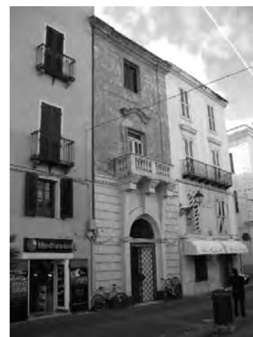
ALGHERO, Piazza Civica, Palazzo Civico.

con certezza che nell'ancona dispersa comparivano i cinque giurati di città 9 : con tutta probabilità erano inginocchiati, in atto di venerazione della Vergine col Bambino, secondo il collaudato schema compositivo catalano della Mare de Déu dels Consellers , che in ambito sardo trova riscontro nei retable delle cappelle municipali cosiddetti “dei consiglieri” 10 . La ricerca sulla Pala civica di Alghero , effettuata presso l'Archivio Storico del Comune, non ha sortito il risultato sperato né per quanto concerne la paternità dell'opera, né in relazione alle modalità della committenza. Ciò nondimeno, sono dell'avviso che l'impostazione delle figure, i caratteristici tipi fisionomici e le tinte cromatiche inseriscano la pala nell'alveo della produzione