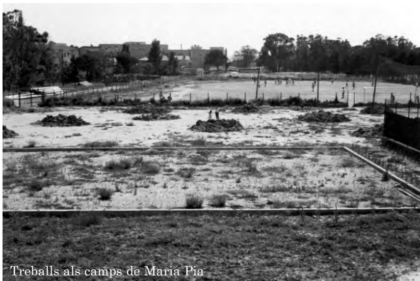
Treballs als camps de Maria Pia