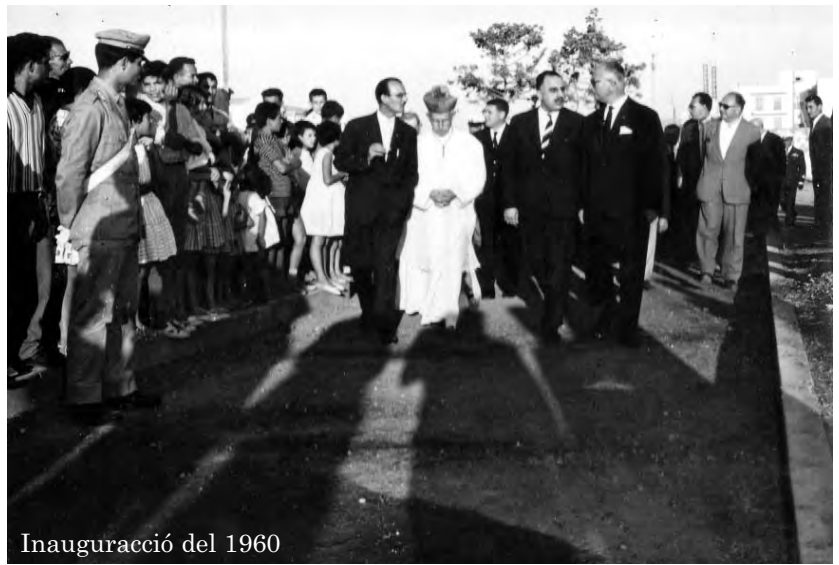
Inauguració del 1960

En aquestos anys l'Alguer, com havem vist, és definida la Porta d'Or del Turisme a Sardenya i, per aquesta raó, el Tennis Club l'Alguer, a través de un finançament adequat de part de la Hisenda Autònoma de Turisme de l'Alguer i de part de la regió Sardenya, al 1965 i al 1966, organitza dos tornejos internacionals, que compten amb la participació