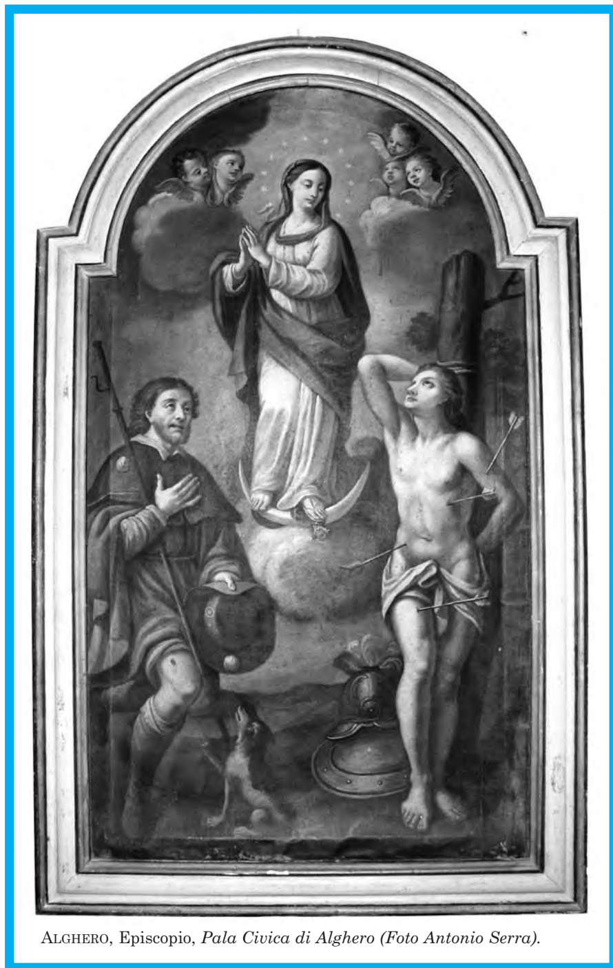
ALGHERO, Episcopio, Pala Civica di Alghero.

In un formato rettangolare centinato e ancora munita della sua cornice lignea originale, ancorché pesantemente ridipinta 5 , la ritrovata Pala civica di Alghero , priva di firma, mostra l'Immacolata