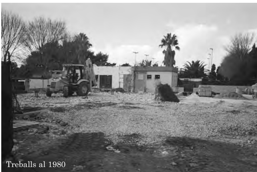
Treballs al 1980