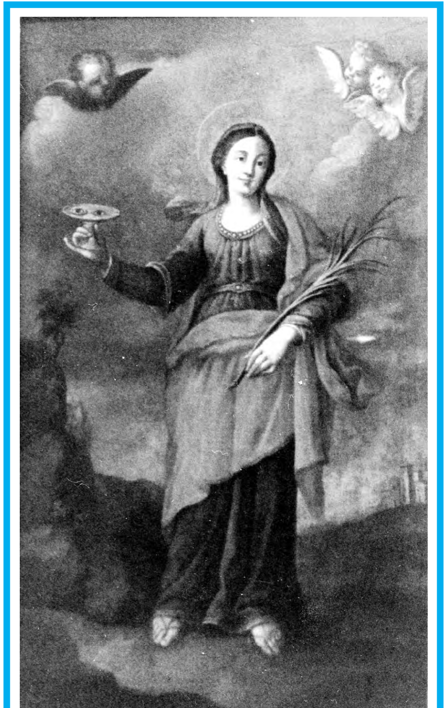
BOLOTANA (NU), Chiesa di S. Bachisio, Pala di S. Lucia

8. Cfr. A. SERRA, Museo Diocesano d'Arte Sacra. Alghero. Catalogo , Cagliari 2000, p. 73 (scheda sulla statua di S. Sebastiano martire); ID., Le chiese cam-