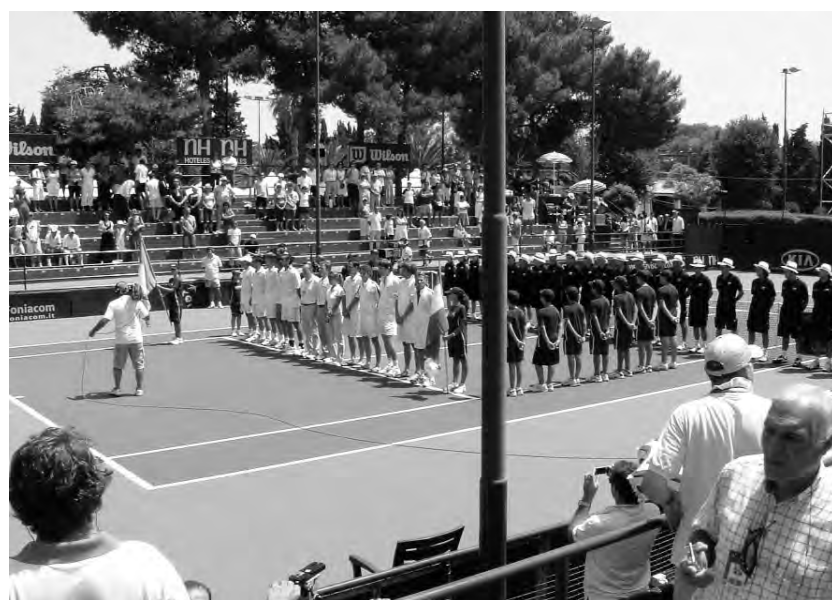
L'encontre de Copa Davis del 2007