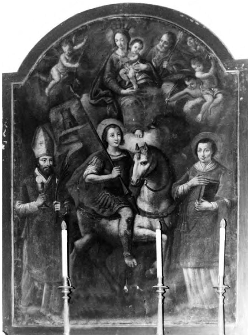
MUROS (SS), Chiesa dei SS. Gavino, Proto e Gianuario, Pala dei Martiri Turrítani.