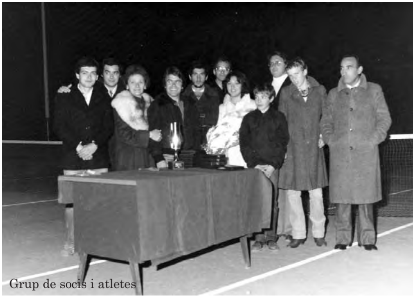
Grup de socis i atletes